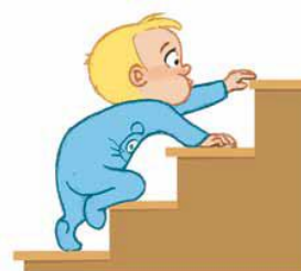
Atelier 3. / 18 à 24 mois